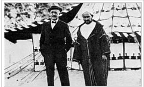
El empresario Horacio Echevarrieta y el líder rifeño Abd el-Krim, durante la reunión que mantuvieron ambos en 1923.

Algunos oficiales y unidades mantuvieron la calma y lograron ponerse a salvo con un número de bajas relativamente pequeño; pero, en su inmensa mayoría, los soldados salieron a la carrera y en completo desorden. El desastre pudo haber sido mayor si los Regulares al mando del comandante Llamas