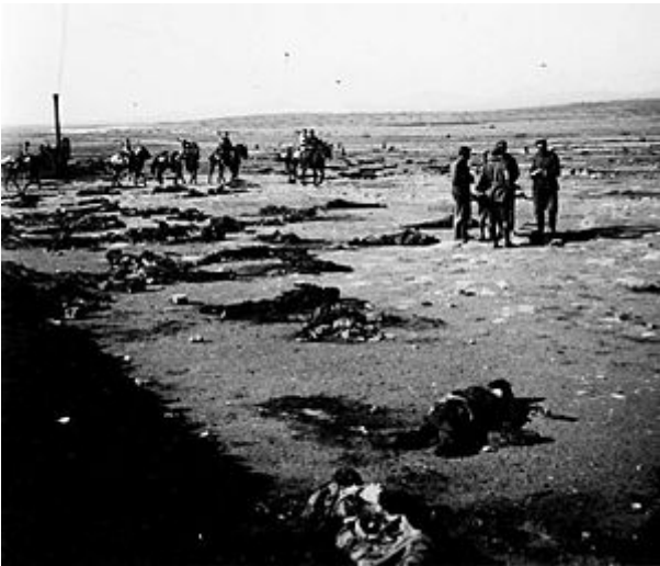
Cadáveres españoles en Monte Arruit. La foto fue tomada meses después del desastre, tras volver a recuperar las posiciones el ejército español.