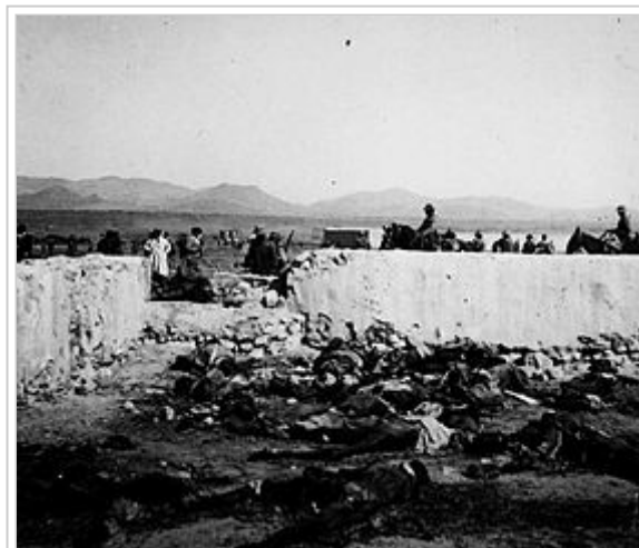
Cadáveres encontrados en Annual

Pronto corrió la noticia de la victoria rifeña, y tanto las cabilas como parte de las fuerzas marroquíes al servicio de España se sumaron a la guerra santa proclamada por Abd el-Krim. nota 7 Ninguna ayuda llegó desde Melilla, situada a unos 40 km, y así las pocas unidades que aún conservaban la disciplina se vieron obligadas a retirarse bajo el constante acoso enemigo hasta Melilla. Se produjo así una espantosa retirada en la que los rifeños asesinaron y torturaron a los heridos, enfermos y a la población civil dejada atrás. [ cita requerida ] Las guarniciones de las posiciones murieron tras duros combates. Lograron escapar vivos los defensores de Afrau, rescatados por la Armada y el destacamento de Metalsa, que logró llegar a las posiciones francesas de Hassi Ouzenga tras perder dos terceras partes de sus efectivos. En Dar Quebdana, el comandante pactó la rendición, pero en cuanto ésta tuvo lugar él y sus hombres fueron descuartizados.