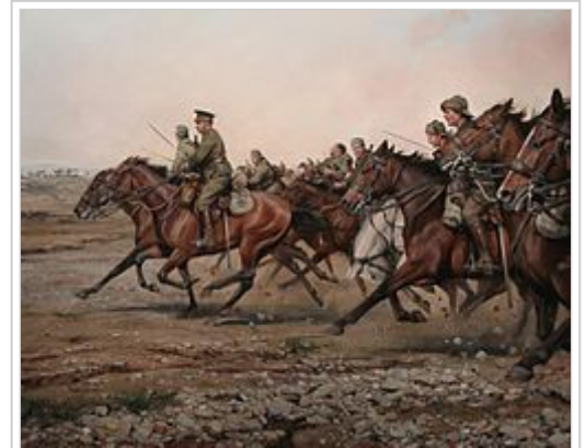
Carga del río Igan , por Augusto Ferrer-Dalmau.

Las pocas fuerzas que pudieron salir vivas, bajo el mando del general Navarro, segundo jefe de la Comandancia de Melilla, retrocedieron hasta Dar Drius, posición bien fortificada y con agua disponible. Sin voluntad de resistencia, creyendo que todo estaba perdido, se replegaron hacia Barbel y Tistuin. En la marcha, al llegar al río Igan, se produjo una nueva huida de oficiales, seguida de la estampida de sus tropas. En medio de aquella desbandada, el Regimiento de "Cazadores de Alcántara", 14 de Caballería, mandado por el teniente coronel Fernando Primo de Rivera y Orbaneja, hermano del futuro dictador, trató de proteger la retirada enfrentándose a las oleadas de indígenas primero con sus ametralladoras y después con sucesivas cargas de caballería. Su sacrificio fue enorme, pues de los 691 jinetes que lo componían, 471 murieron, lo que supuso un 80 por ciento de bajas. Pero gracias